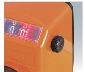
Positioning push button Nullstellungsknopf