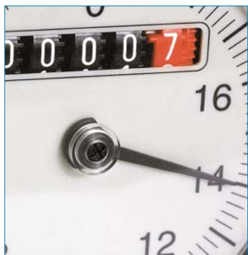
Vite di posizionamento Positioning screw Positionierschraube